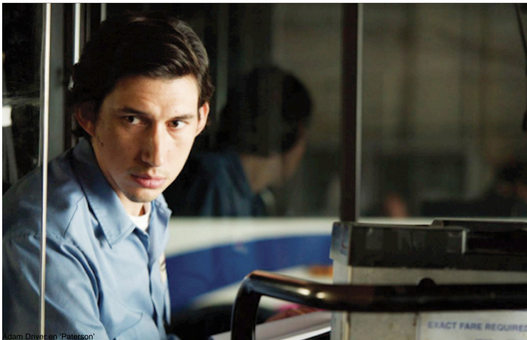
Adam Driver en 'Paterson'

Puede que no sea perfecto, pero Shyamalan logra mostrar un frente unificado dentro de "Split". La película es, sin duda, llena de carácter, combinando las fortalezas técnicas y temáticas de Shyamalan con fuertes actuaciones para asegurarse de que cada giro y vuelta capta nuestra atención y lo mantiene como rehén, mucho después de que la película haya terminado.