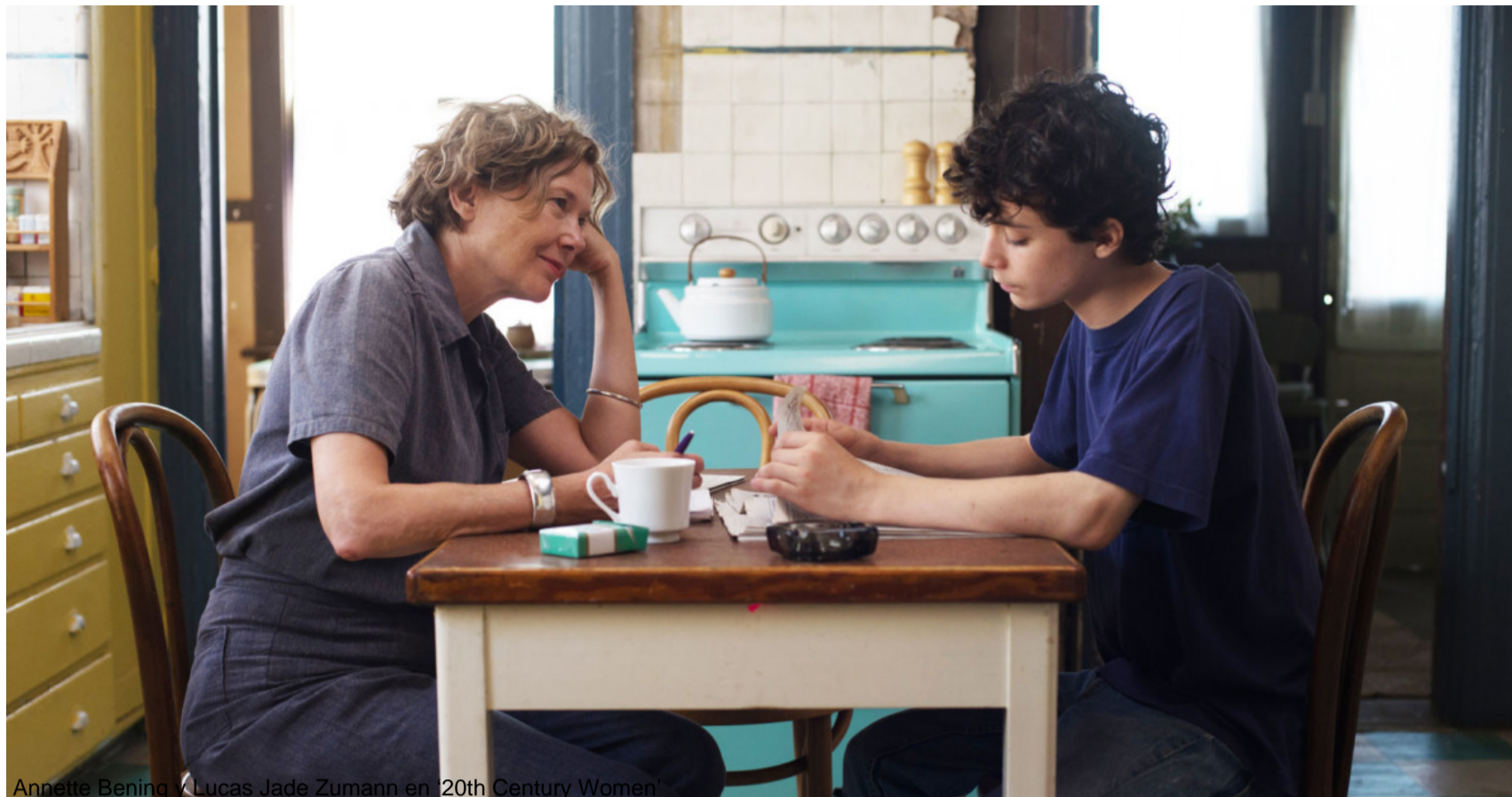
Annette Bening y Lucas Jade Zumann en 20th Century Women